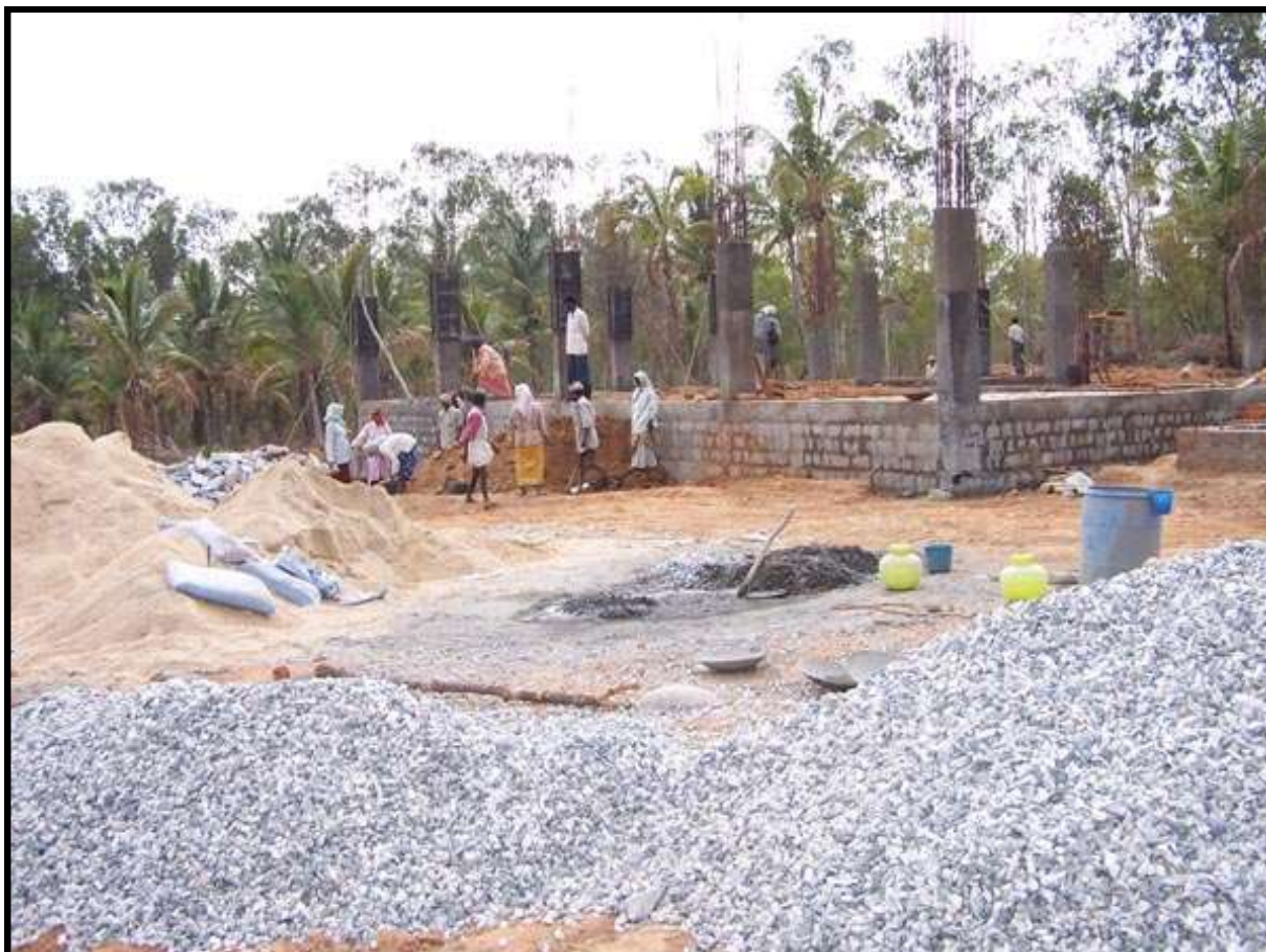
INIZIO DEI LAVORI PER LA COSTRUZIONE DELL'ORFANOTROFIO ( Marzo 2007 )