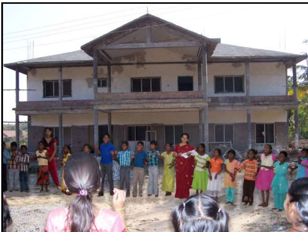
1° FEBBRAIO 2008 SI ACCOLGONO I PRIMI BAMBINI!