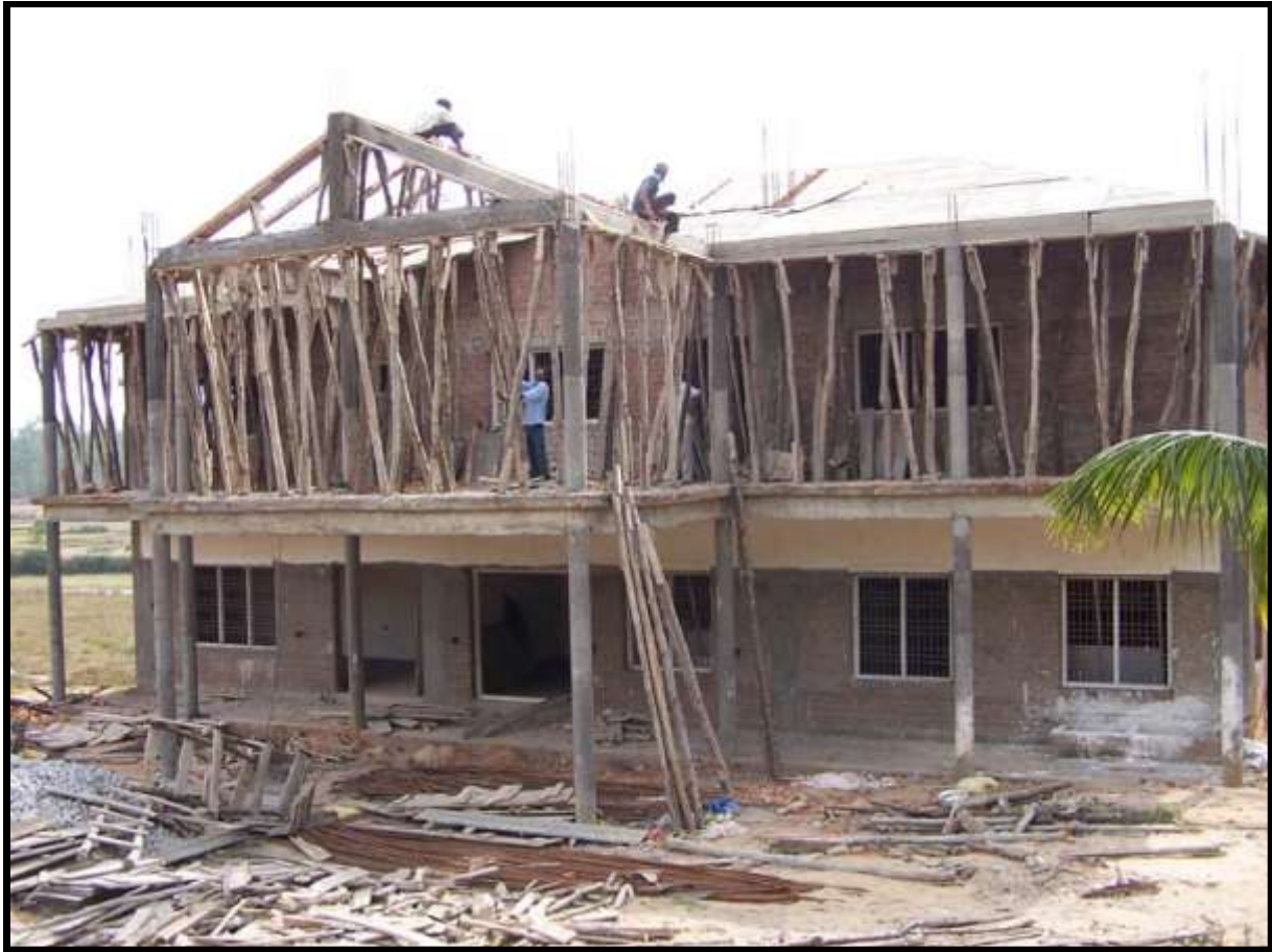
SETTEMBRE 2007, SI LAVORA PER FABBRICARE SERRAMENTI E PORTE