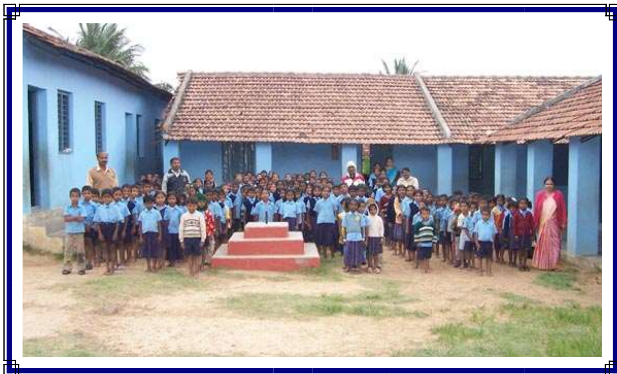
SCUOLA DEL VILLAGGIO DI ADISHAKTHINAGAR