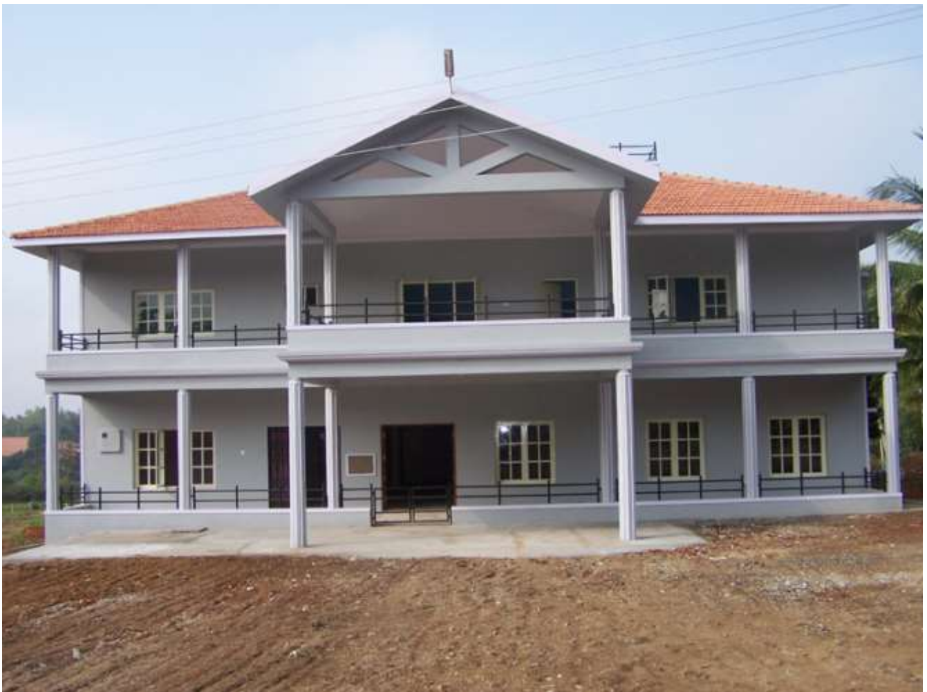
The dream building of LNI and Sarvodaya Organisation ASARE CHILDREN'S HOME