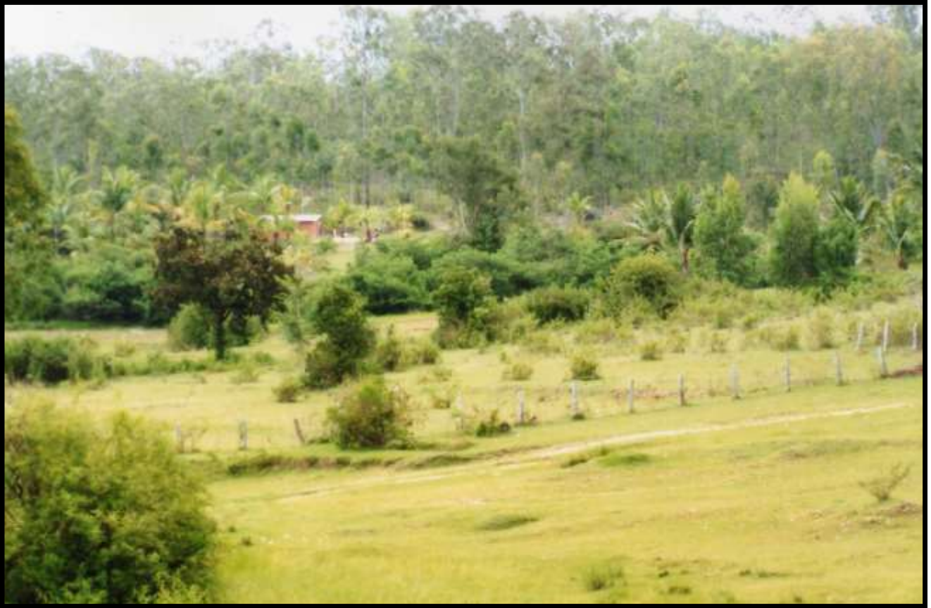
AMPIA VEDUTA DEL TERRENO ACQUISTATO. SISTER SUMA SI ACCERTA DELLE CONDIZIONI E DELLE DIMENSIONI