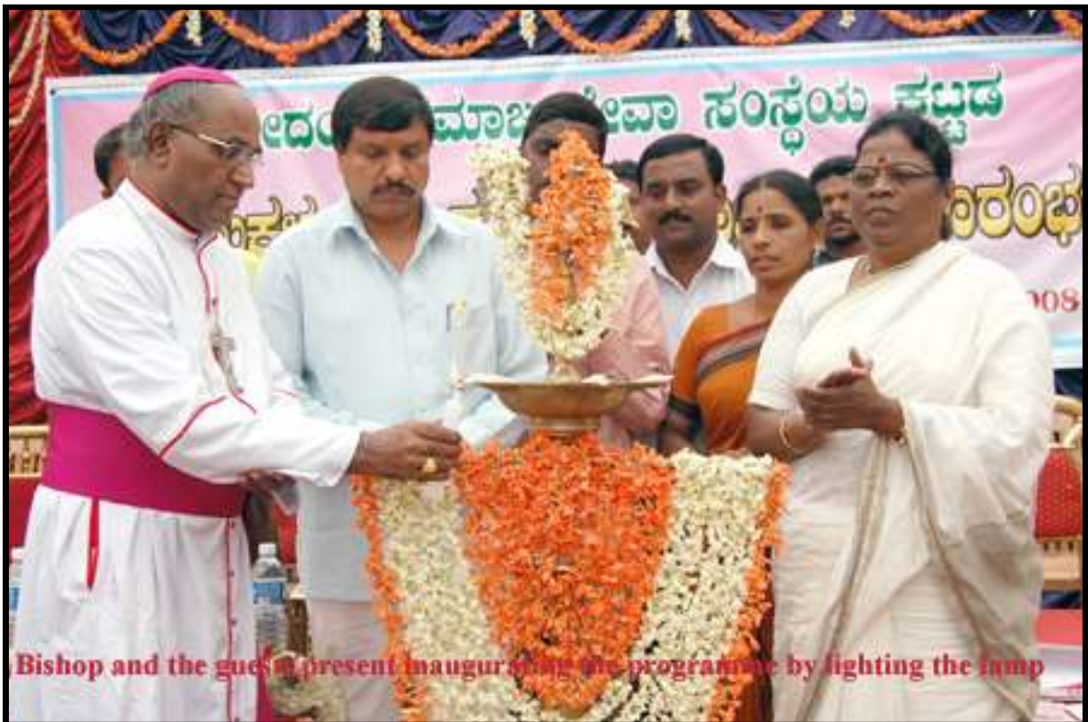
Bishop and the guests present inaugurating the programme by lighting the lamp