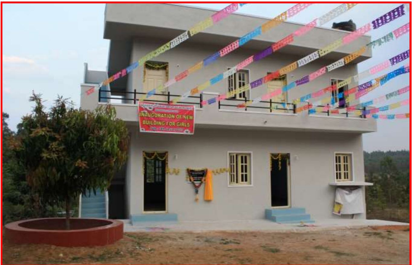
Costruzione di un Centro d'accoglienza per bambine vittime di violenze sessuali Sahaya Project 2014