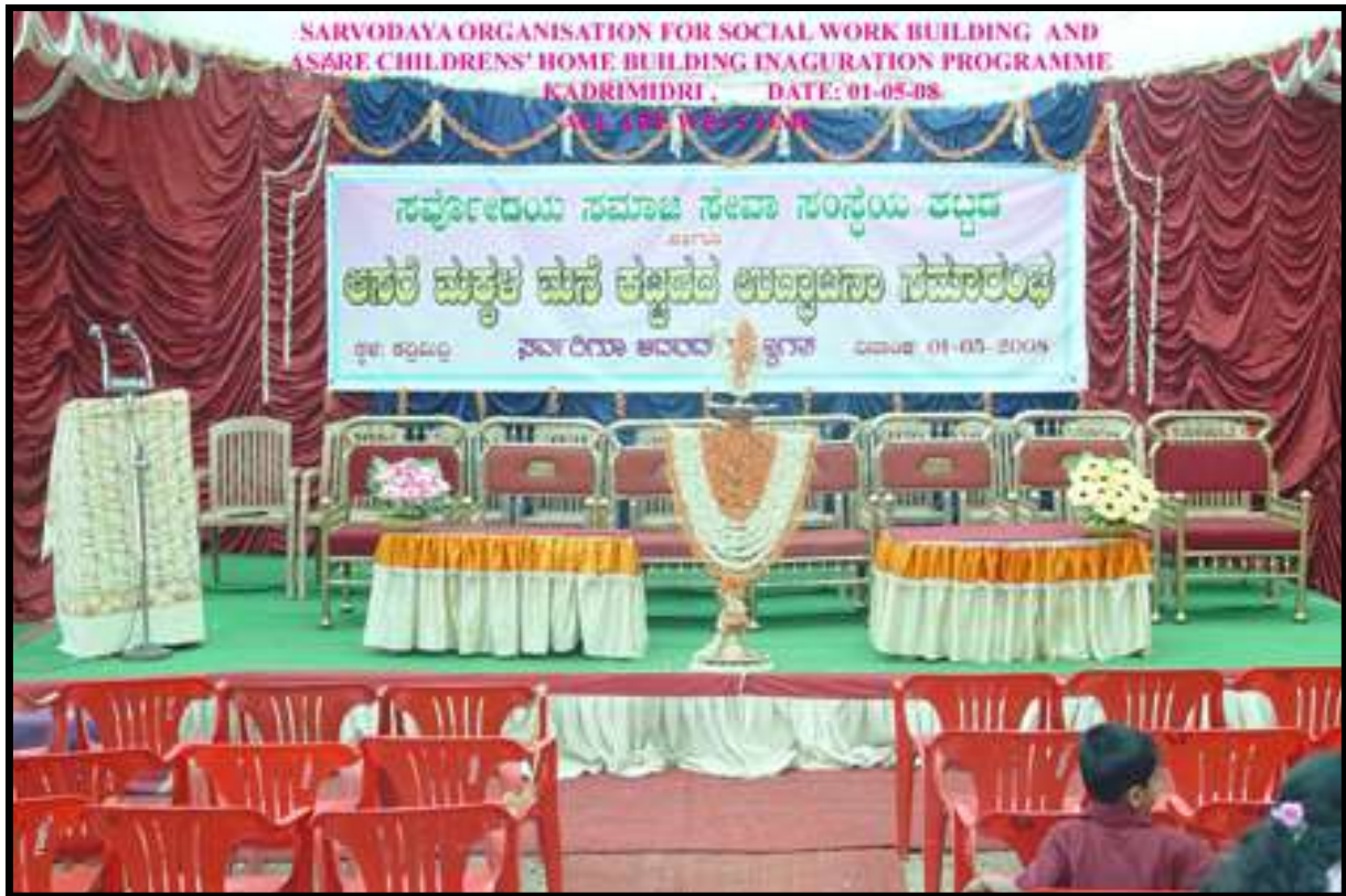
INAUGURAZIONE DELL'ASARE CHILDREN'S HOME, 1 MAGGIO 2008