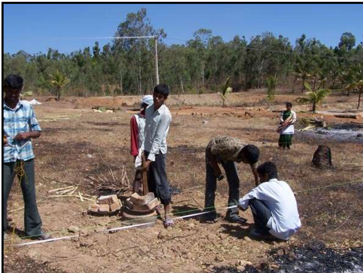
MISURAZIONI E INIZIO DEGLI SCAVI