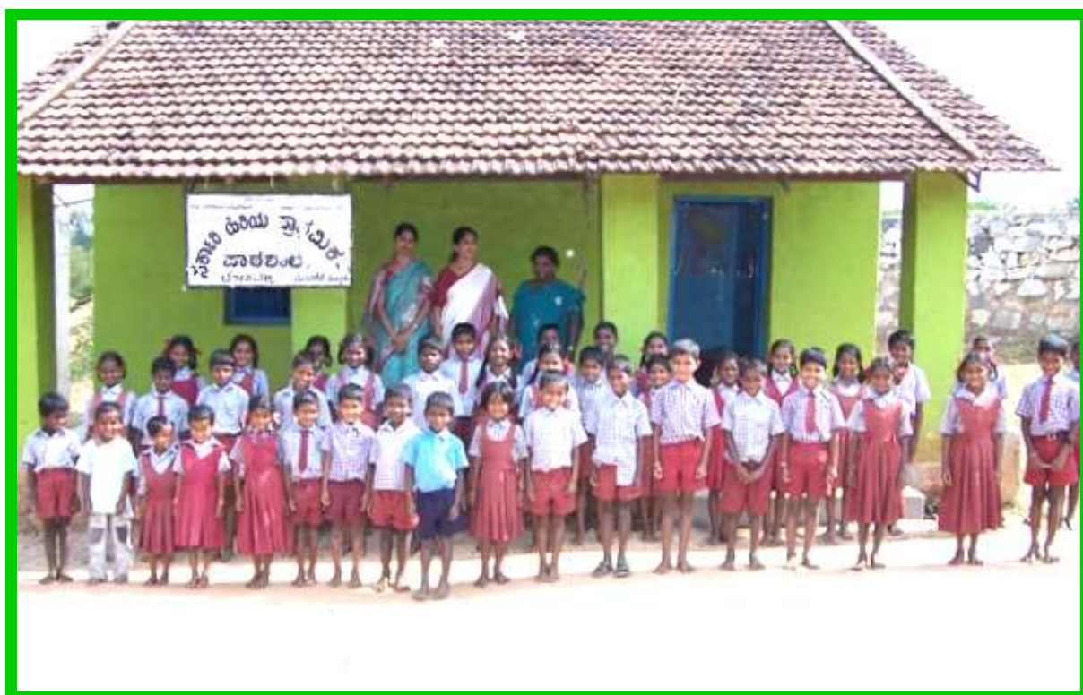
SCUOLA DEL VILLAGGIO DI LOKOHALLI