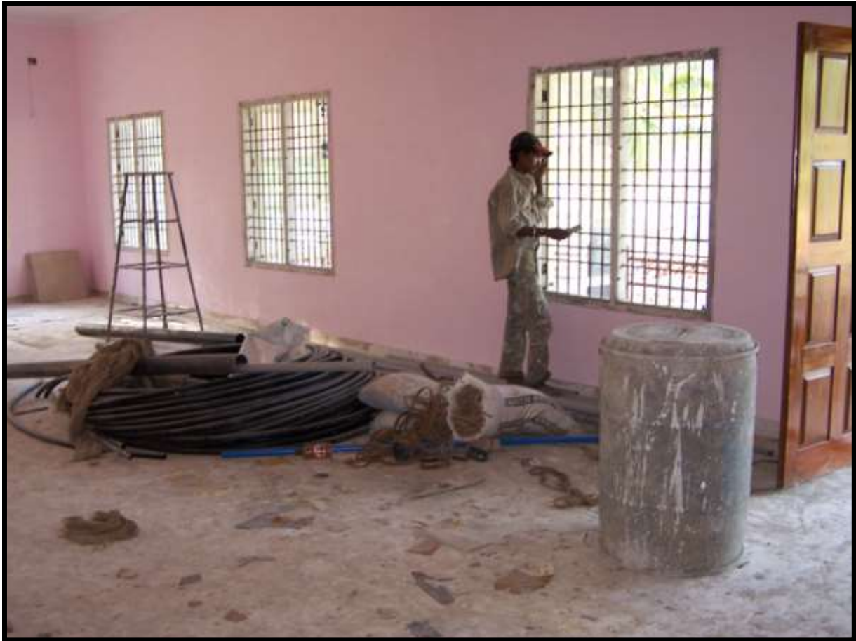
I LOCALI INTERNI SONO QUASI ULTIMATI