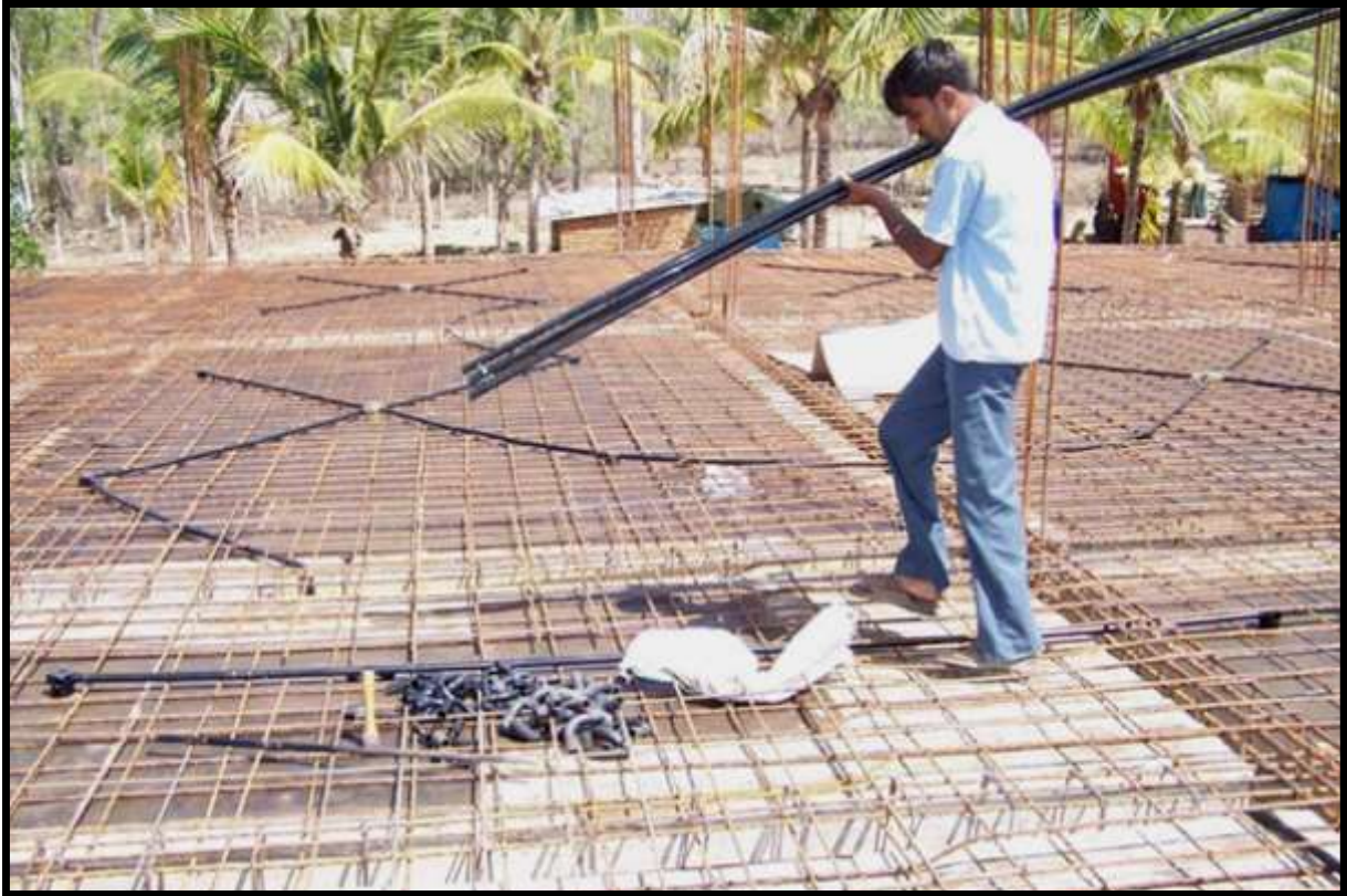
GIUGNO 2007, AVANZAMENTO DEI LAVORI