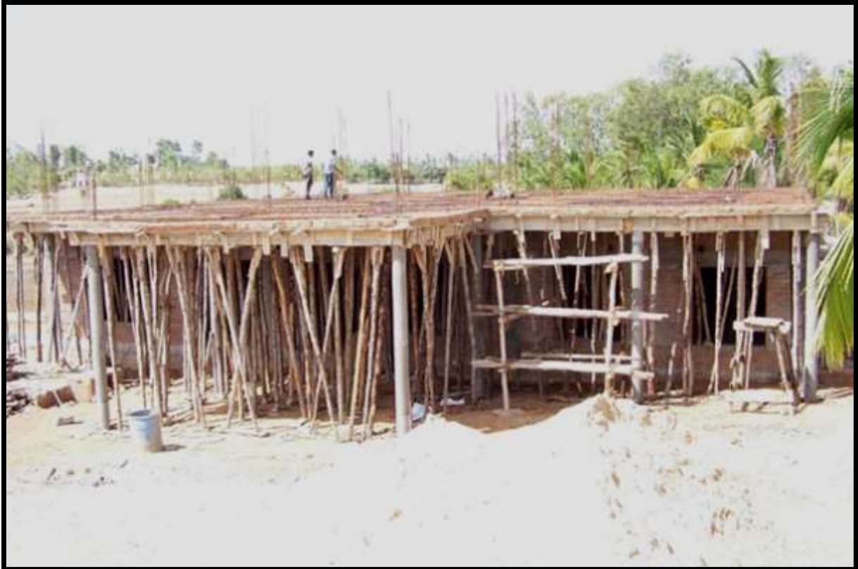
SI PREDISPONE L'IMPALCATURA PER COSTRUIRE IL SECONDO PIANO DELL'EDIFICIO